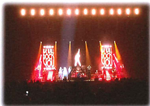
Freddie 70 years