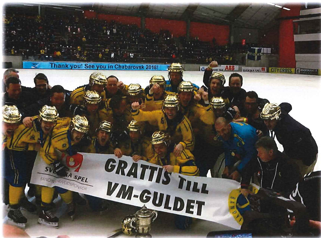
Bandy VM 2017

Utan några större förändringar i uppdraget, kommer bolagets ekonomiska resultat att ligga på de senaste årens nivåer.