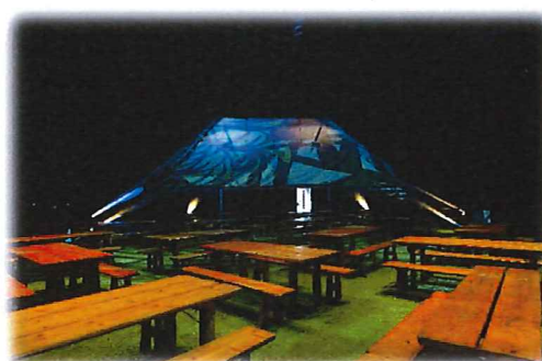
Matsal under konferens