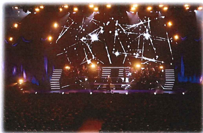
Björn Skifs 2018