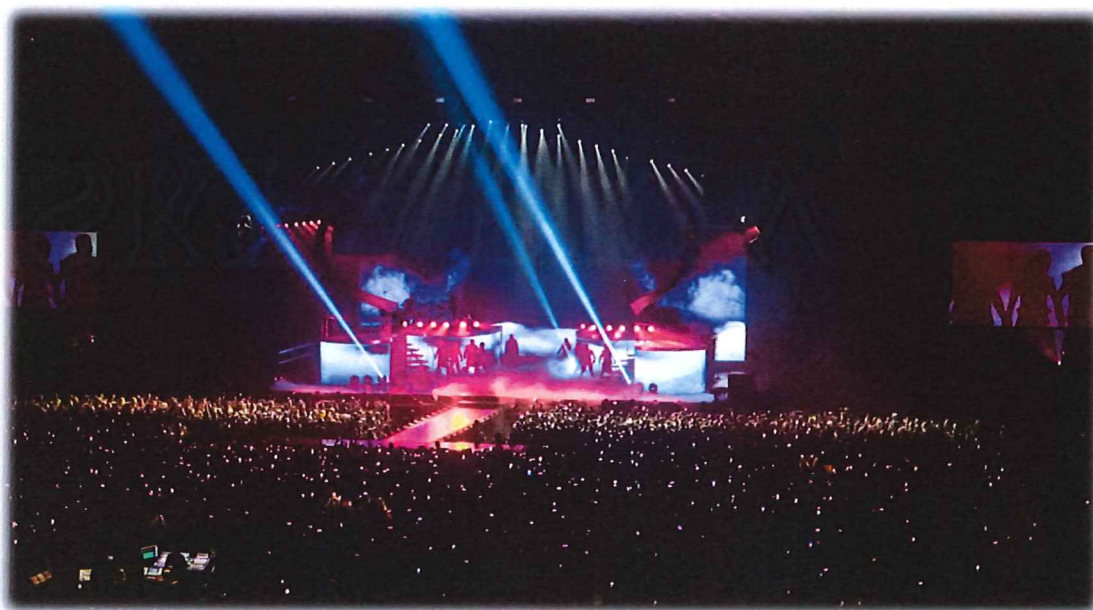
Britney Spears aug 2018

Göransson Arena har hittat en position på arenakartan som skiljer sig från många av konkurrenterna. Genom sin storlek, belägenhet, organisation och offensiva strategi kan arenan erbjuda arrangörer och partners unika fördelar. Erbjudandet kommer att ytterligare stärkas i takt med när kommunen tar ett helhetsgrepp i destinationsfrågan. Detta är en förutsättning för att arenabolaget och dess verksamhet skall fortsätta ligga i framkanten på en starkt konkurrensutsatt marknad.